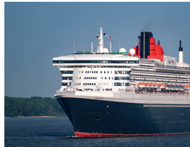
Queen Mary II / FIPRO® Dekorativer Brandschutz