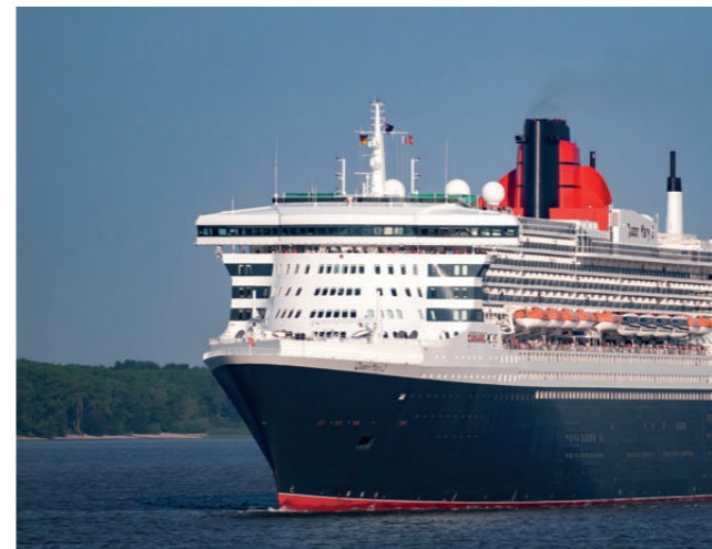
Queen Mary II / FIPRO® Dekorativer Brandschutz