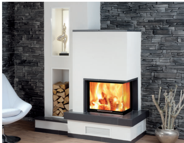
Anwendungsbeispiel: Kaminummantelung mit THERMAX® Konstruktionsplatten