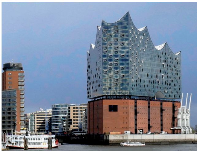
Elbphilharmonie, Hamburg / THERMAX® Brandschutz Deckenkonstruktion