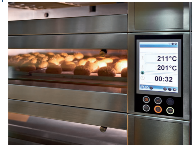
Anwendungsbeispiel: MultiTHERM® 550 auf kleinstem Raum in Industriebacköfen